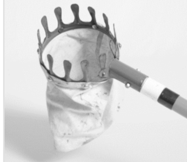
MERGERS & ACQUISITIONS

Plausibilisierung des Businessplans und der Planungsrechnungen ausgerichtet auf Kapitalbeschaffung